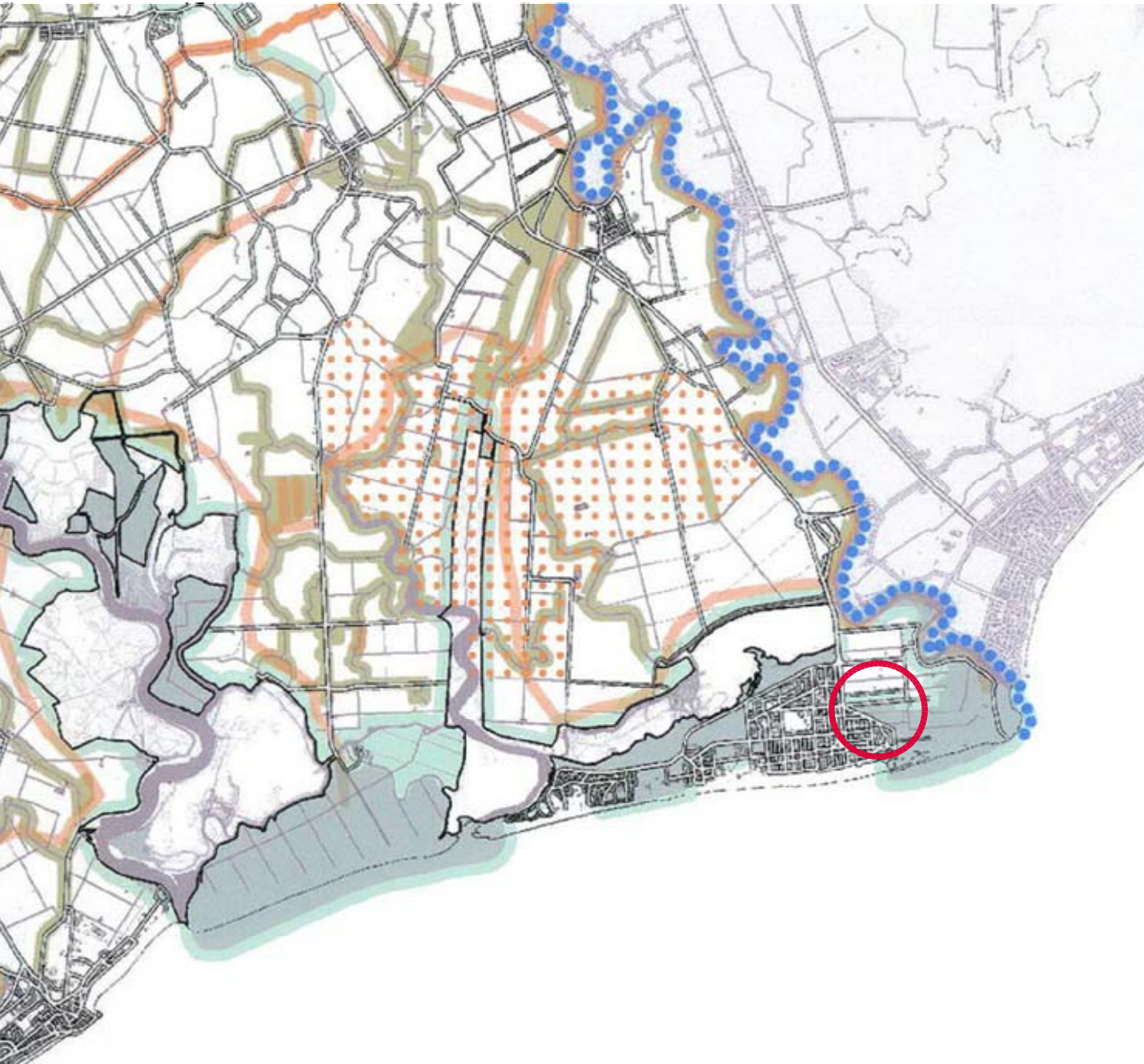
Estratto P.T.C.P. Venezia - Sistema ambientale, aree naturali protette e Rete Natura 2000 - scala 1:100.000

Confine provinciale Parco Lombrina Regional Aree naturali protette da Elenco Ufficiale (Delibera della Conferenza Stato Regioni del 24/7/2005) Rete Natura 2000 Zona di Protezione Speciale (ZPS)