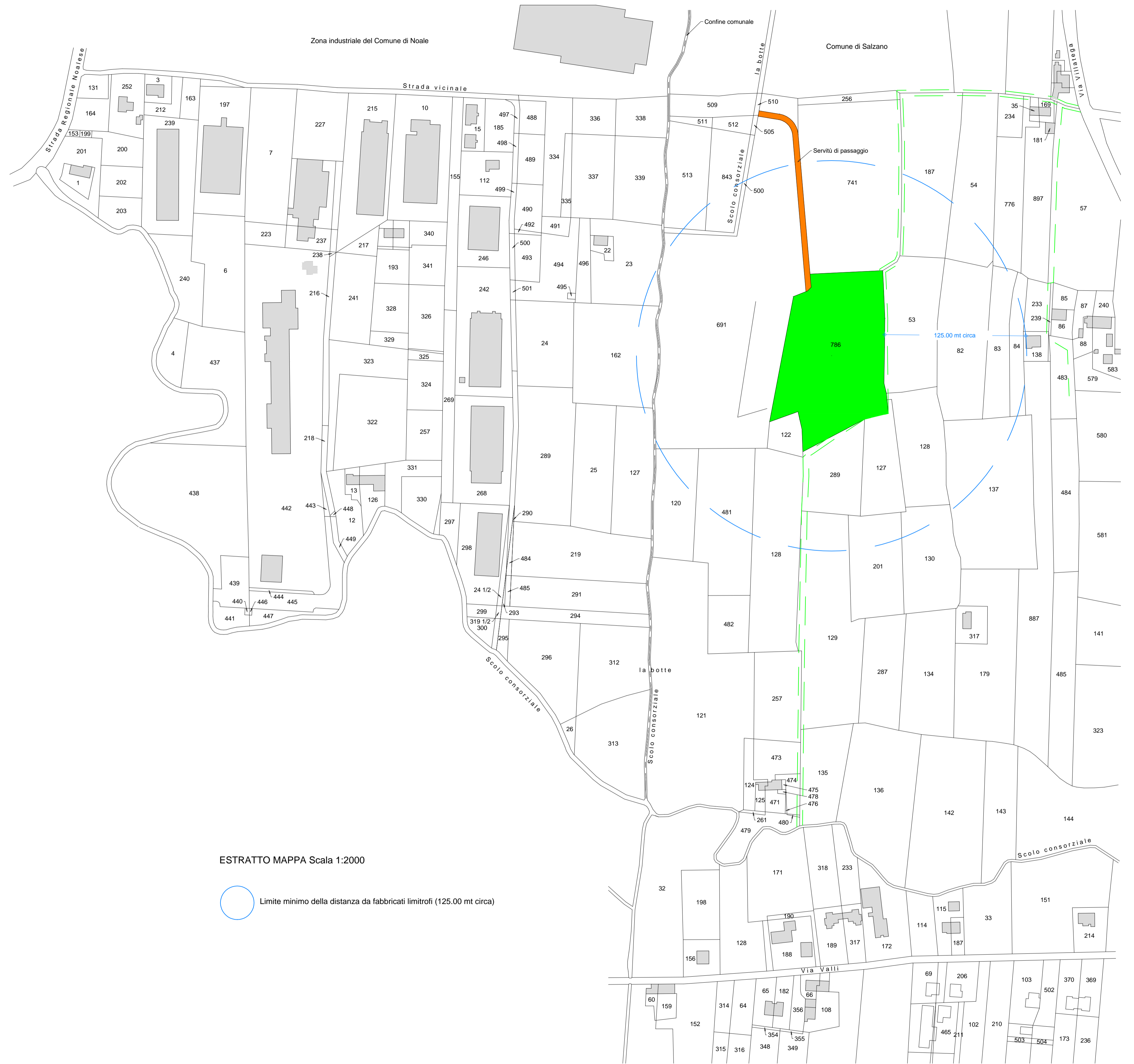
ESTRATTO MAPPA Scala 1:2000

Disegno riservato a termine di legge con divieto di riproduzione e di renderlo noto a terzi senza autorizzazione scritta. - Ogni trasgressione verrà perseguita a termine di legge