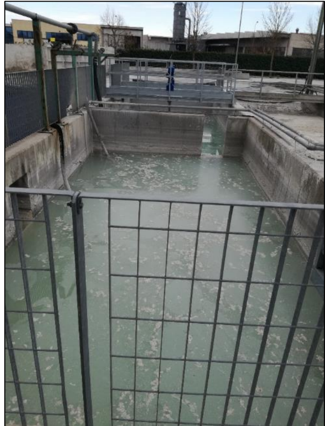
Fig. 10: Vasche accumulo acque meteoriche di dilavamento