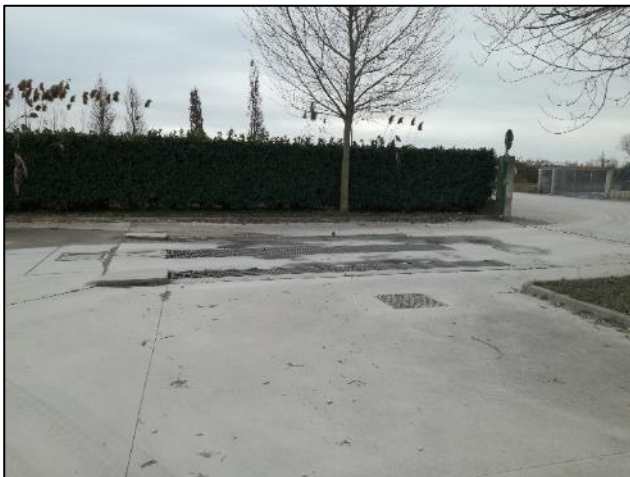
Fig. 13: Varco uscita mezzi e impianto lavaggio ruote