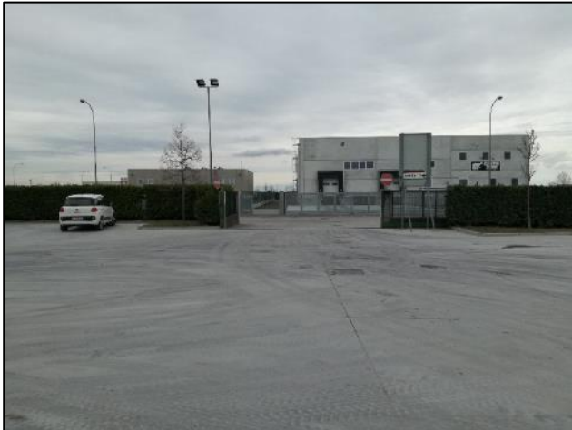
Fig. 5: Ingresso mezzi