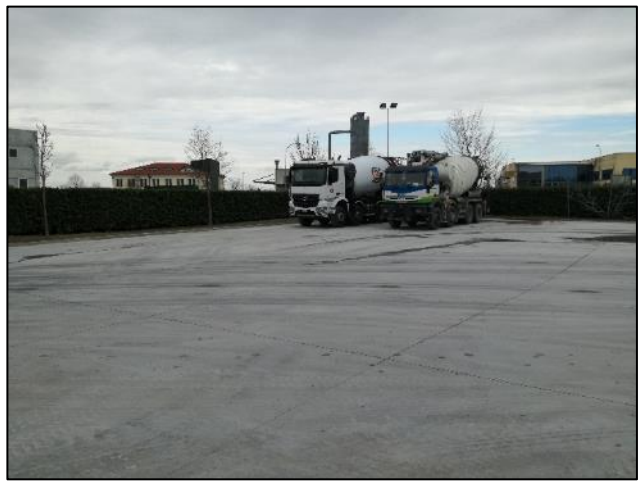
Fig. 2: Zona parcheggio automezzi