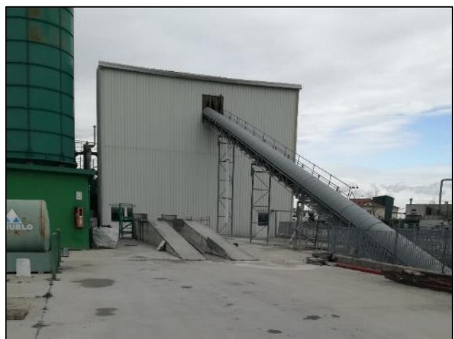
Fig. 8: Nastro trasportatore