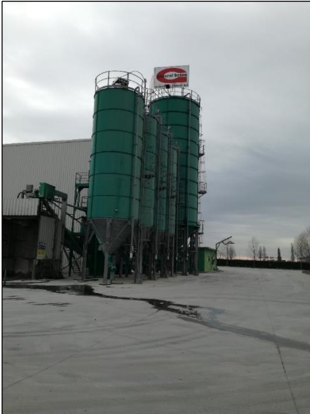
Fig. 9: Silos