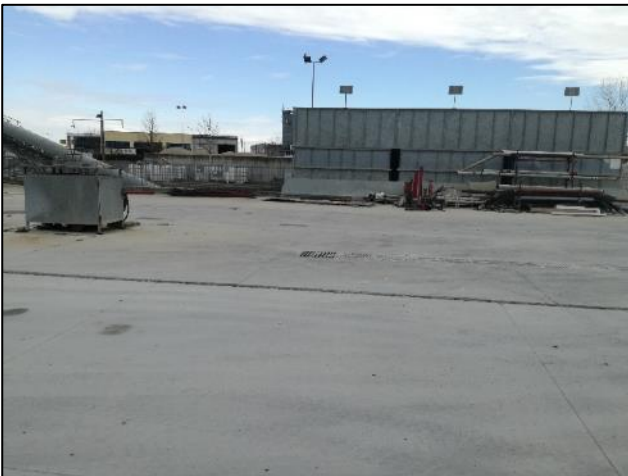
Fig. 3: Piazzola lavaggio mezzi