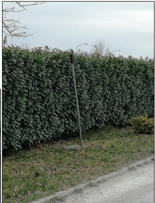
Fig. 14: Impianto bagnatura piazzale