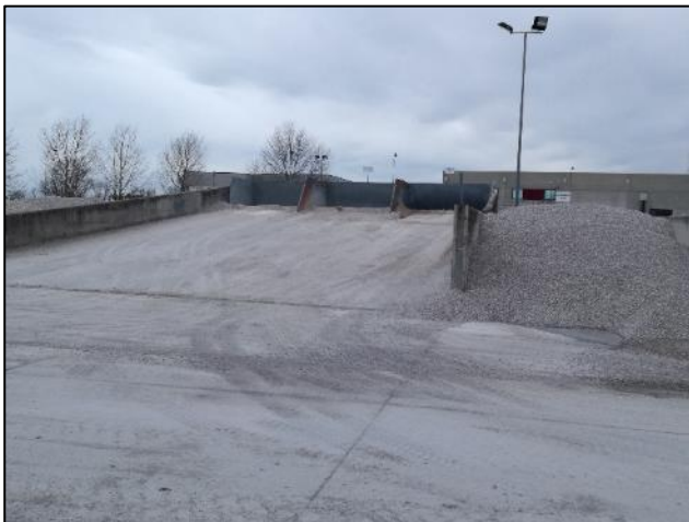
Fig. 7: Rampa carico inerti su tramogge