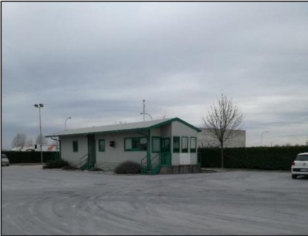
Fig. 1: Edificio uffici