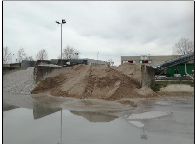
Fig. 6: Vista piazzale e deposito materie prime inerti