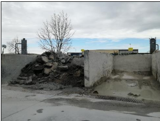
Fig. 11: Deposito temporaneo e griglie captazione acque