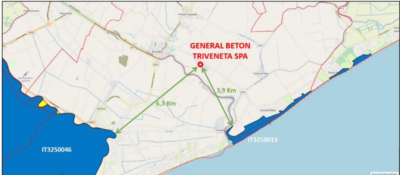
Fig. 17: Distanza del sito General Beton Triveneta SpA dalla ZPS IT3250046 e dal SIC IT3250013

Per quanto riguarda l'area protetta della laguna del Mort, invece, gli elementi di disturbo sono minori, perché l'intera area che le separa è prevalentemente utilizzata a fini agricoli. Si segnala la presenza di traffico intenso, però, durante il periodo estivo.