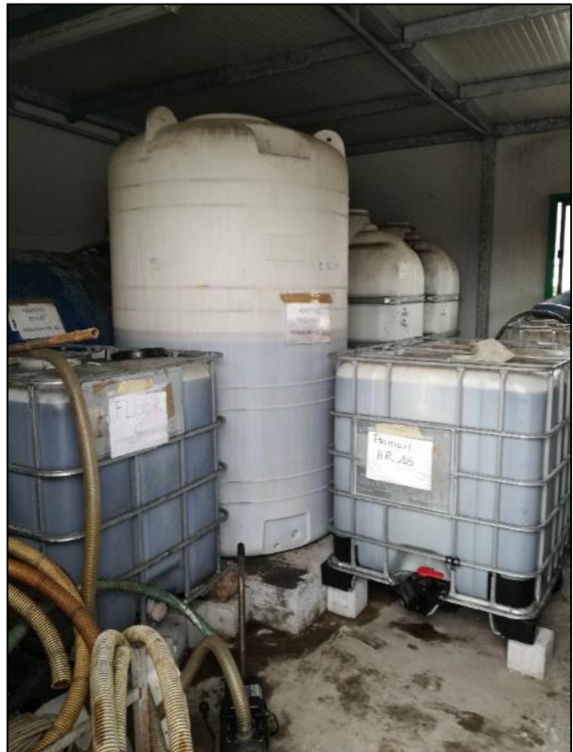
Fig. 4: Vista interno deposito reagenti (l'intero locale costituisce un bacino di contenimento)