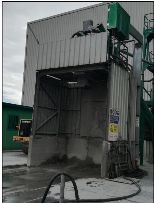
Fig. 12: Bocca di carico mezzo