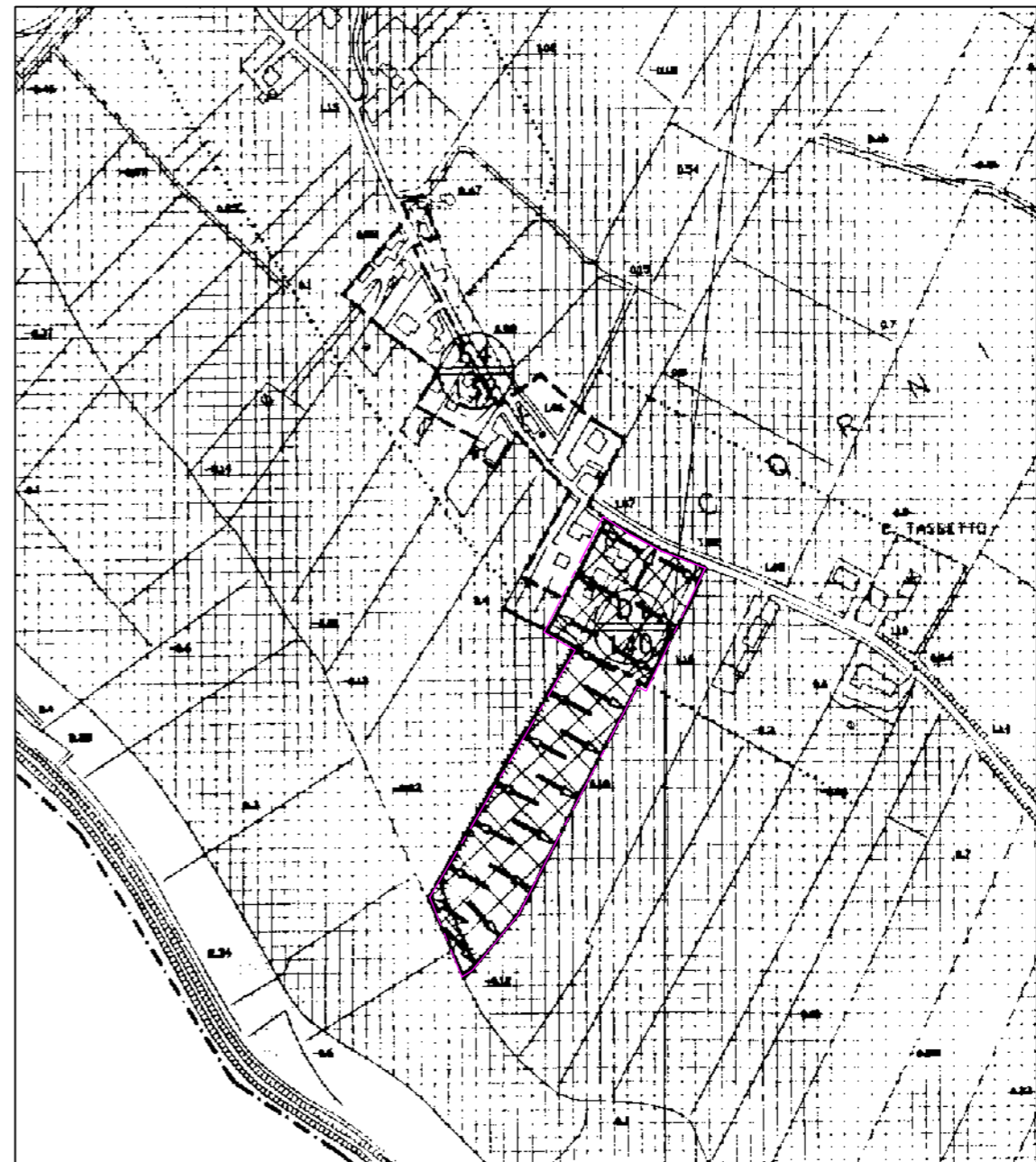
ESTRATTO PIANO REGOLATORE Scala 1: 5000