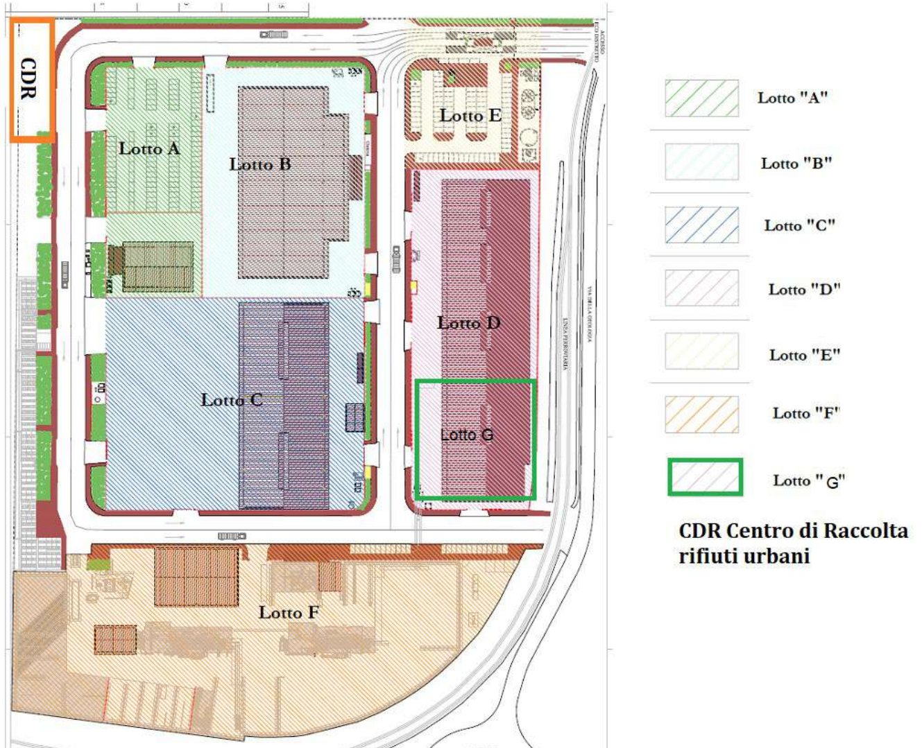
Immagine n. 3 – Lotti

L'immagine seguente illustra l'organizzazione dell'area "10 ha" che è funzionalmente suddivisa di Lotti.