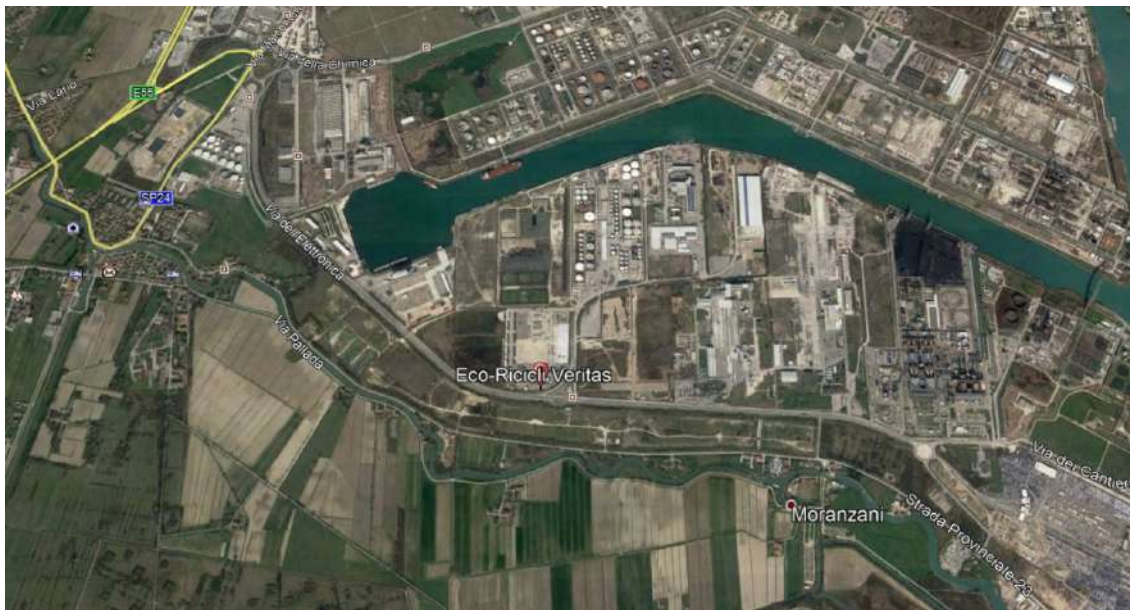
Immagine n. 4

ripartizione dei flussi su varie entrate, non da ultimo, la deviazione dei flussi verso Marghera e le altre zone industriali e, dall'altro, rendendo più fluida ed agevole, la circolazione su Via dell'Elettronica, anche per effetto delle nuove rotatorie di accesso a Via delle Geologia ed ai poli per la gestione dei rifiuti (VERITAS, ECO+ECO e Ecoprogetto Venezia).