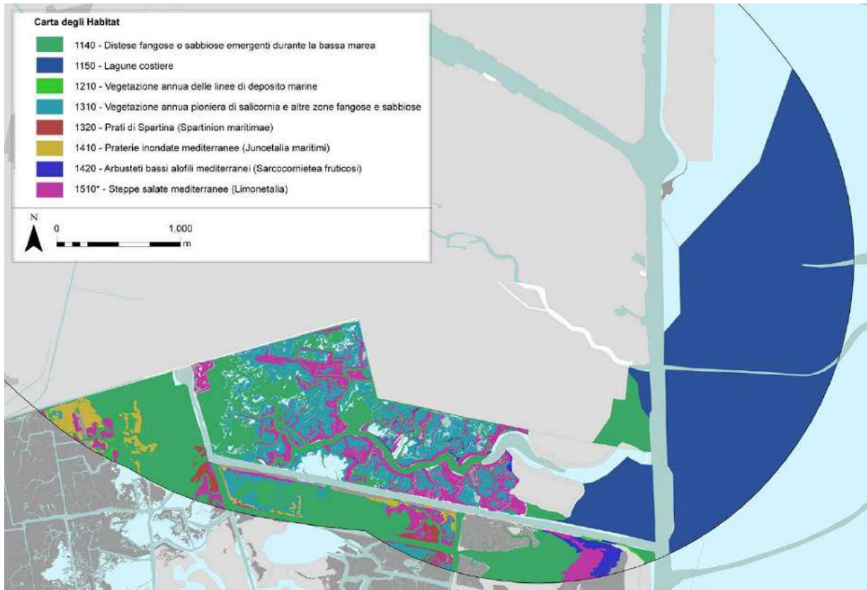
Immagine n. 6

La tabella seguente illustra invece il grado di conservazione degli illustrati habitat.