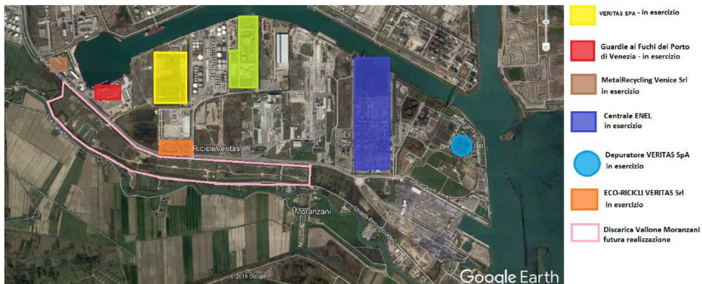
Immagine n. 7