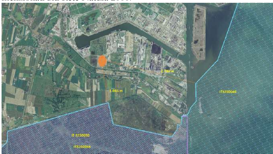
Immagine n. 1 estratta dal sito del MATT

L'immagine seguente illustra l'ubicazione della sede della ditta ECO+ECO Srl in relazione ai menzionati Siti Rete Natura 2000.