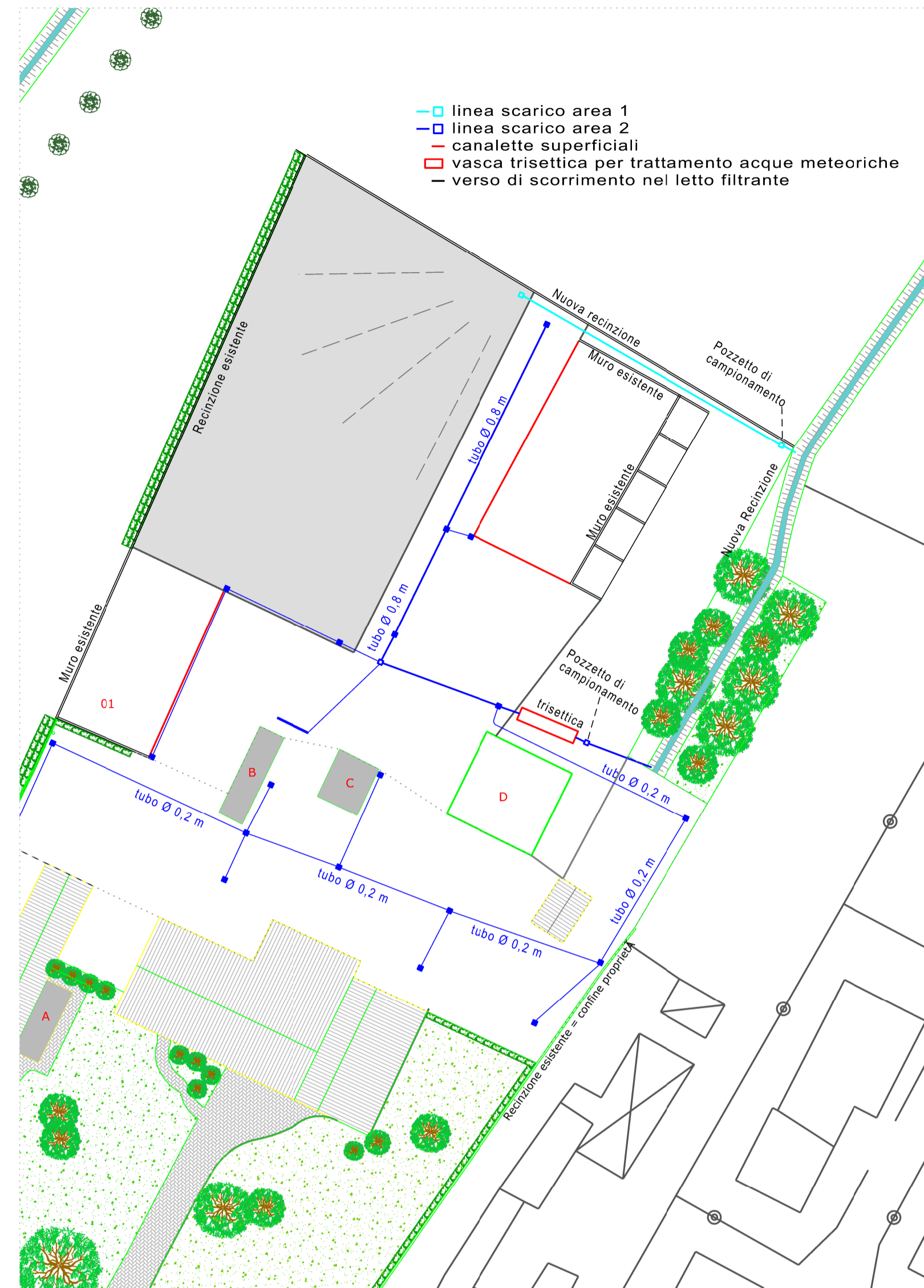
RETE DI RACCOLTA ACQUE METEORICHE: scala 1:500