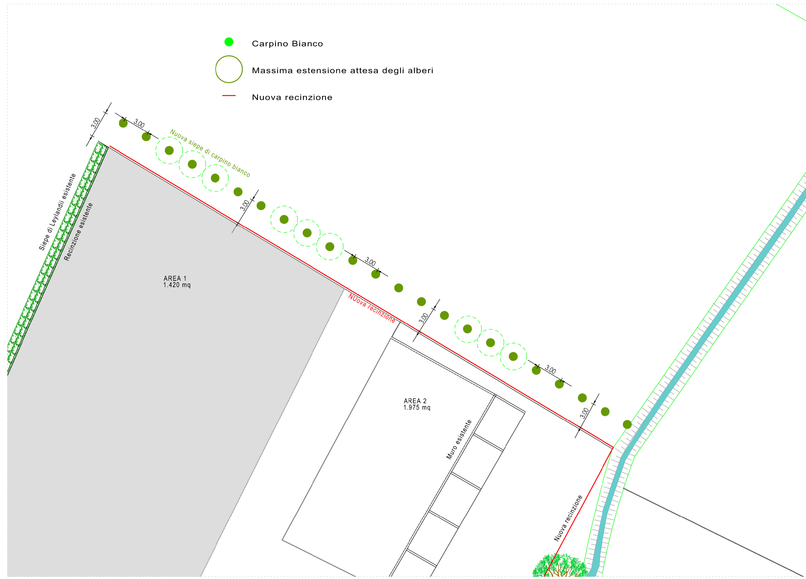
NUOVA RECINZIONE E PIANTUMAZIONE LATO NORD: scala 1:250