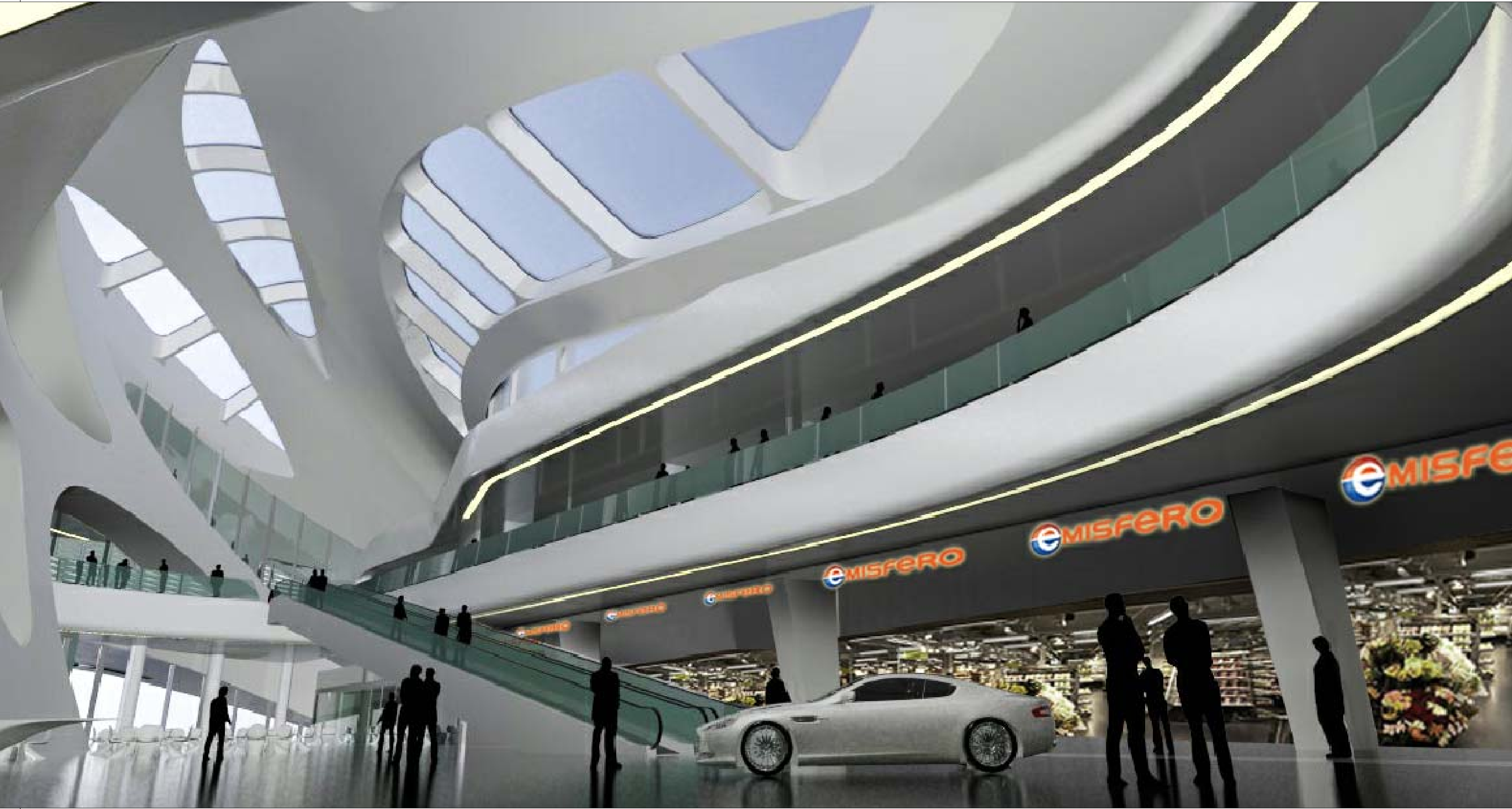
02 VISTA INTERNA PIANO TERRA FOOD COURT - FRONTE FOOD