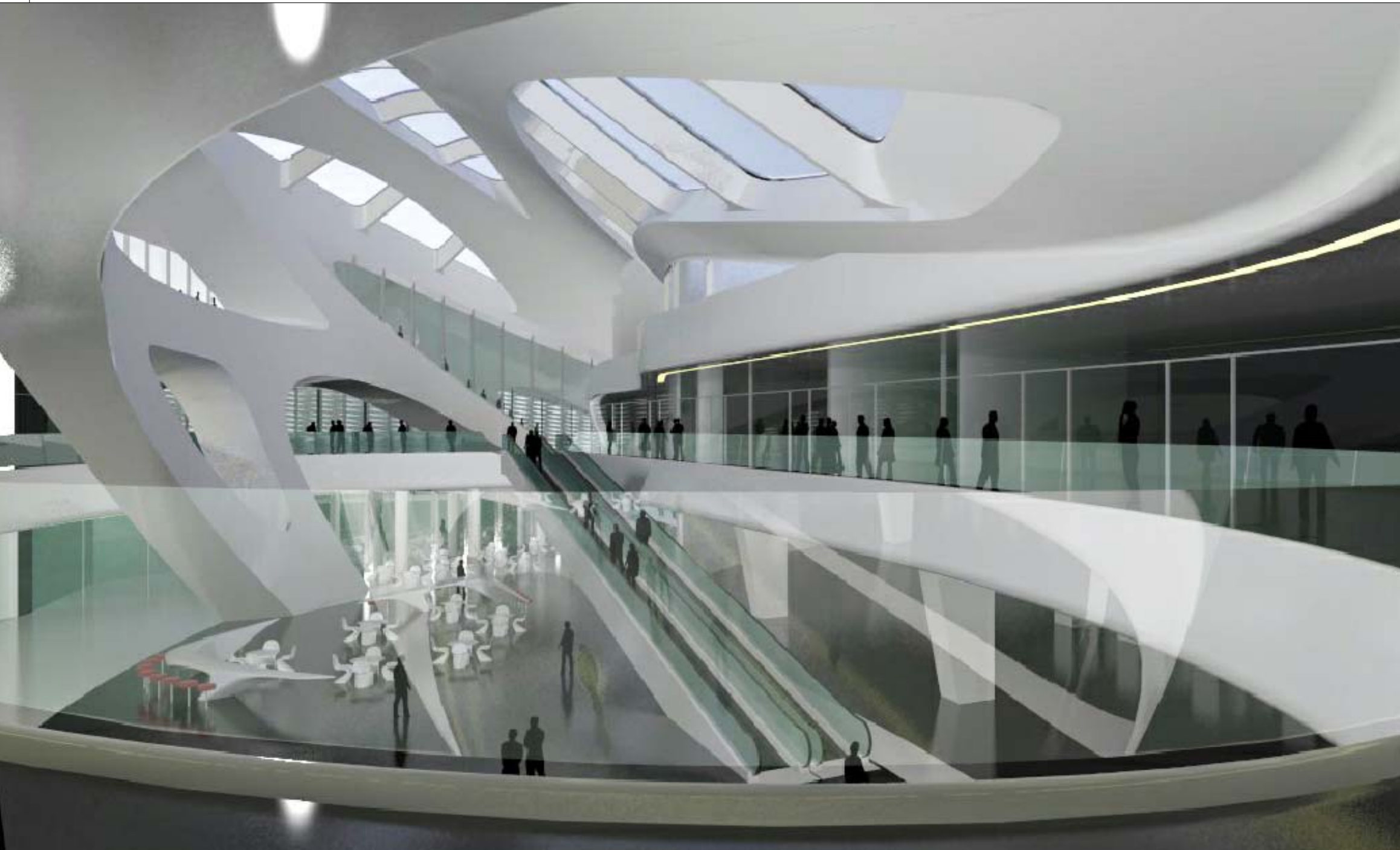
04 VISTA INTERNA PIANO PRIMO GALLERIA NORD