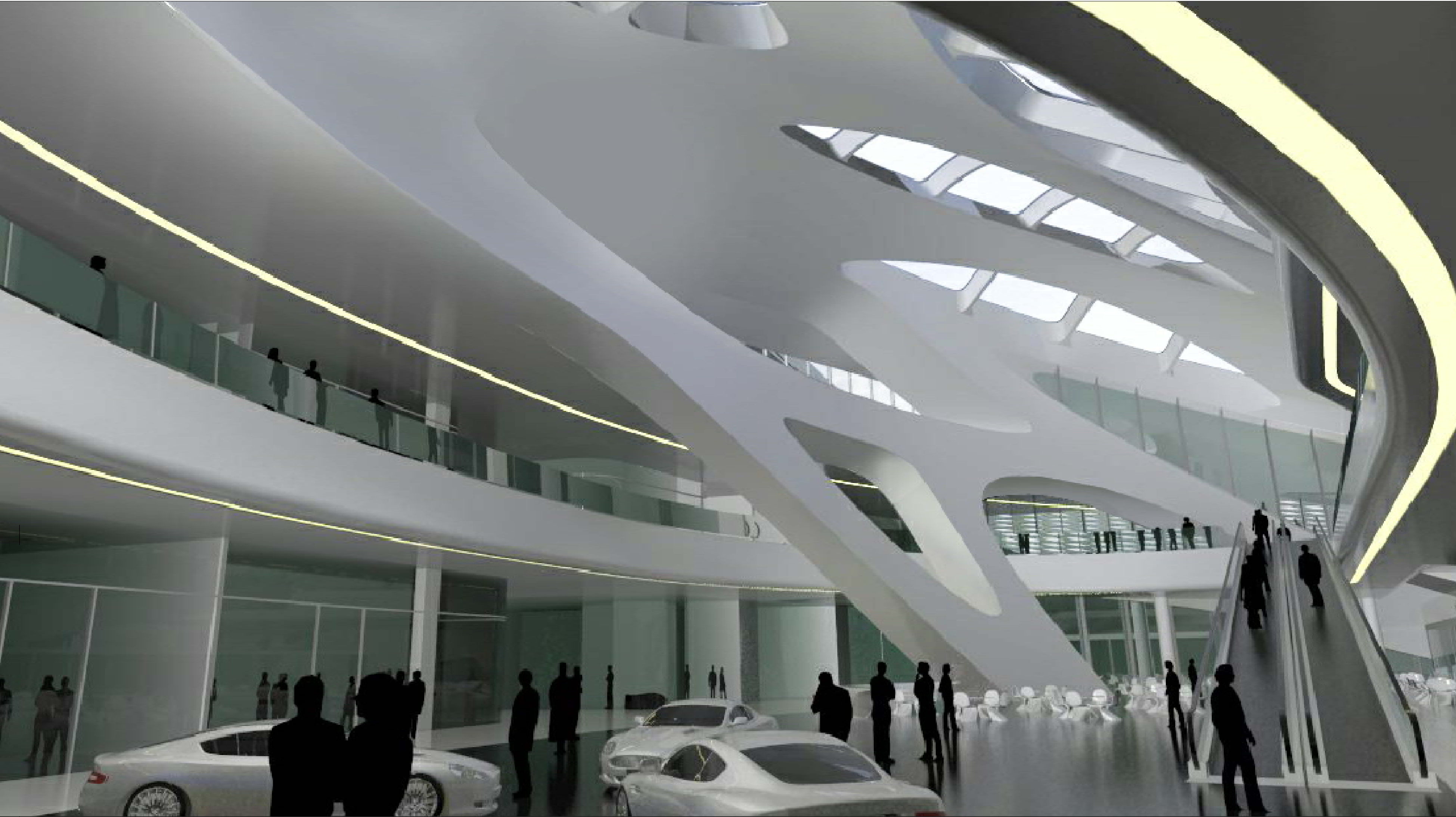
01 VISTA INTERNA PIANO TERRA FOOD COURT