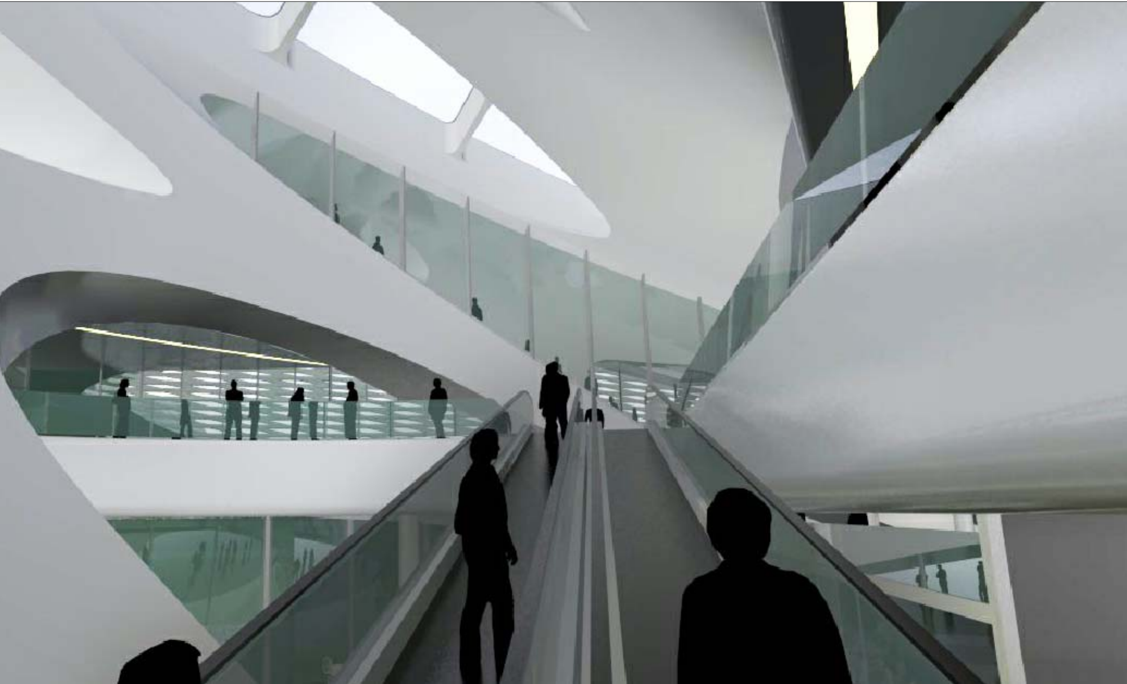
03 VISTA INTERNA FOOD COURT - SALITA TAPPETI MOBILI