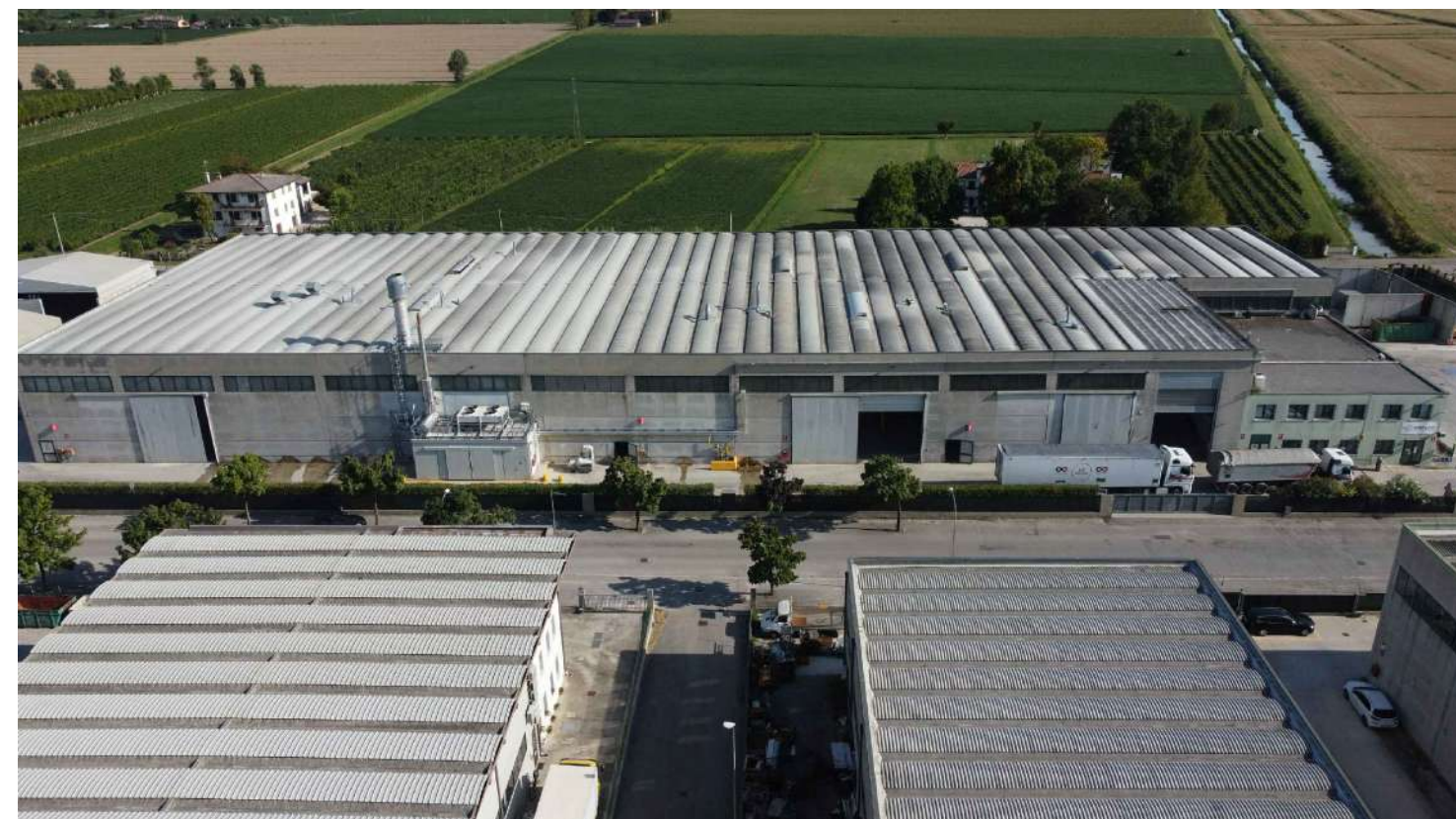
Fig. 01 - Vista lato Nord-Ovest civ. 41

VIA Gracia Deledda, 15 30027 San Donà di Piave, VE P.IVA 02397562719 TEL. +39 0421-223305 E-MAIL studi@dus.it