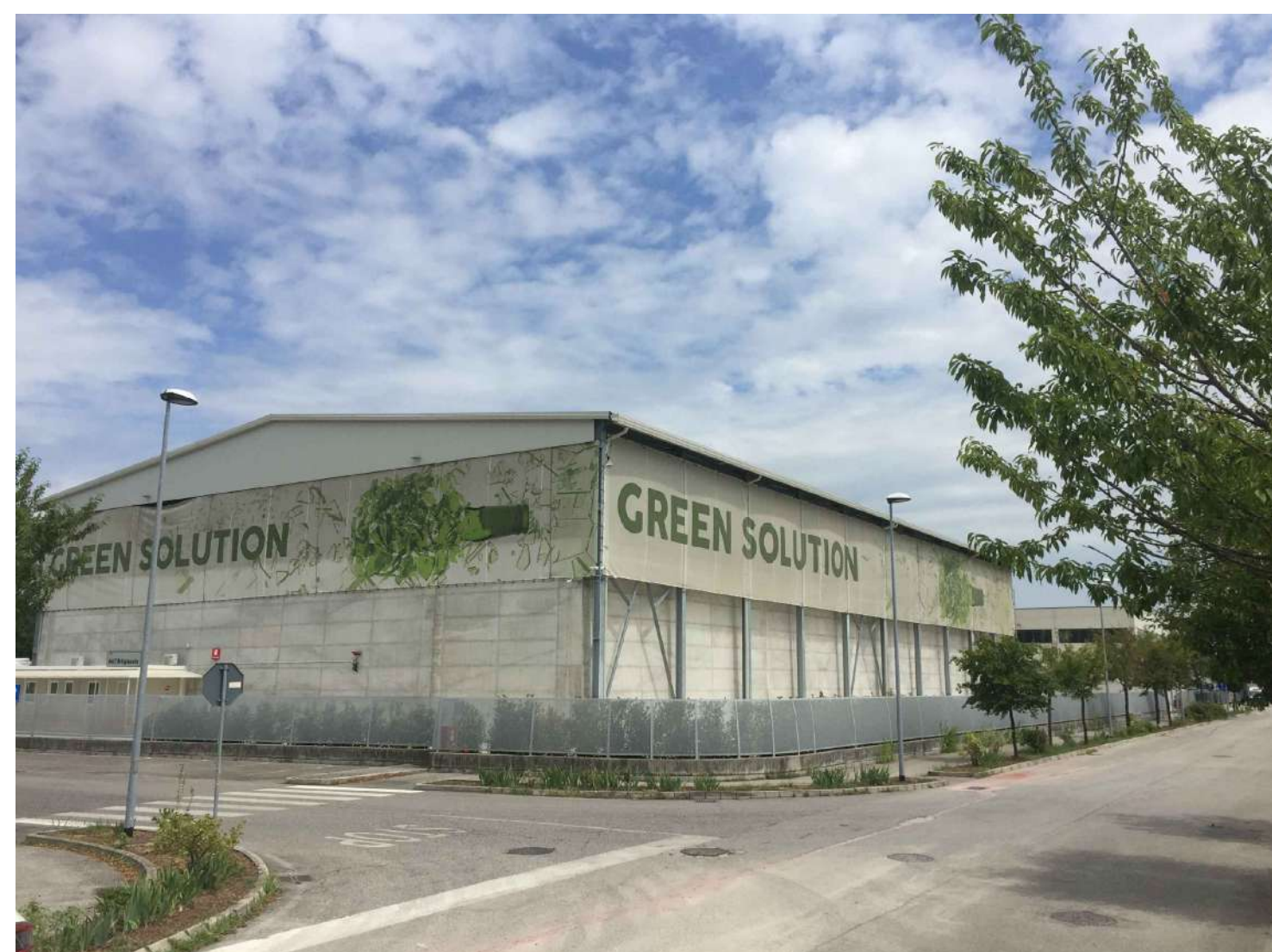
Fig. 07 - Vista lato Sud civ. 56