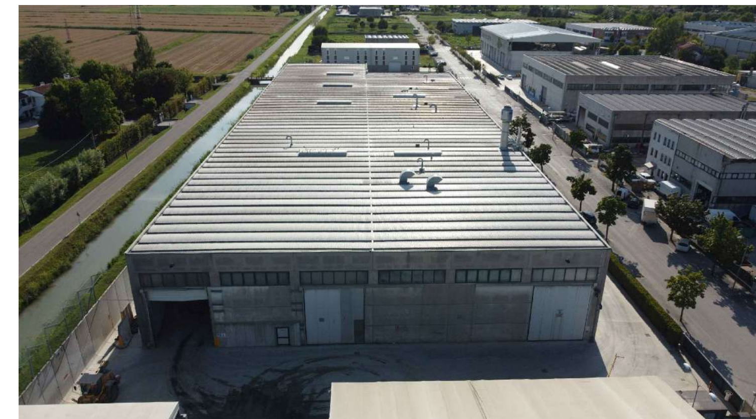
Fig. 04 - Vista lato Est civ. 41