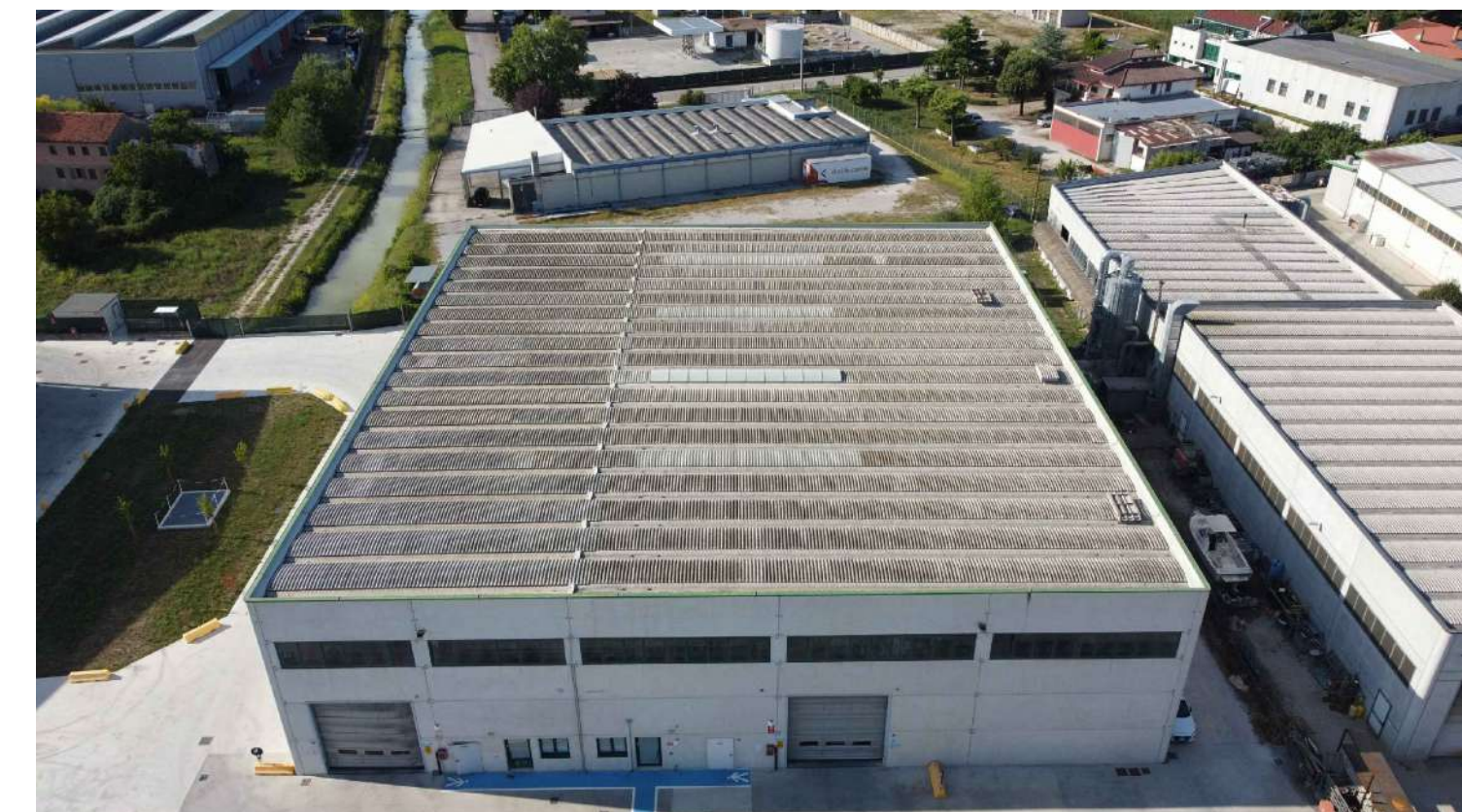
Fig. 06 - Vista lato Sud-Est civ. 54