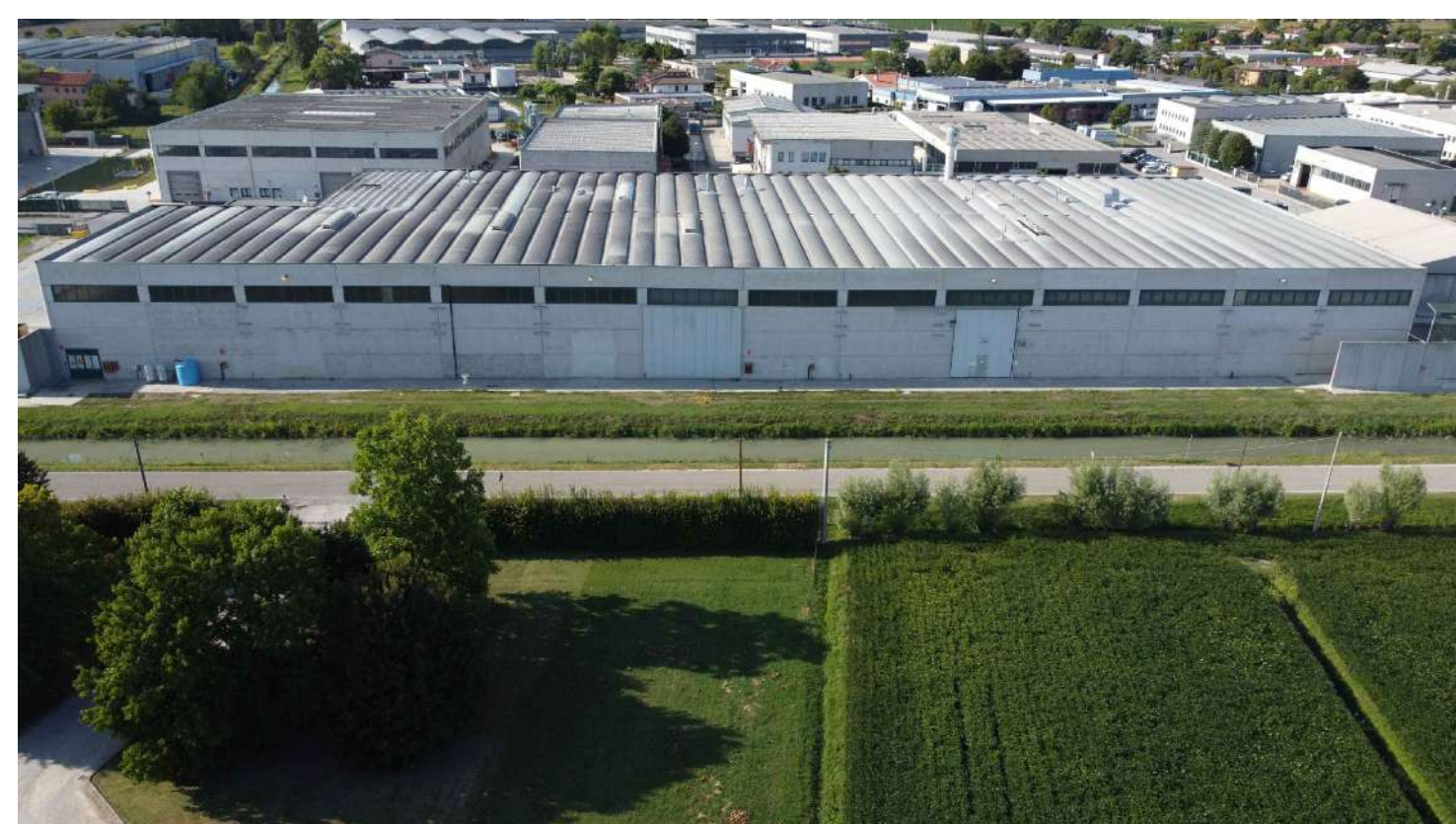
Fig. 03 - Vista lato Sud-Est civ. 41