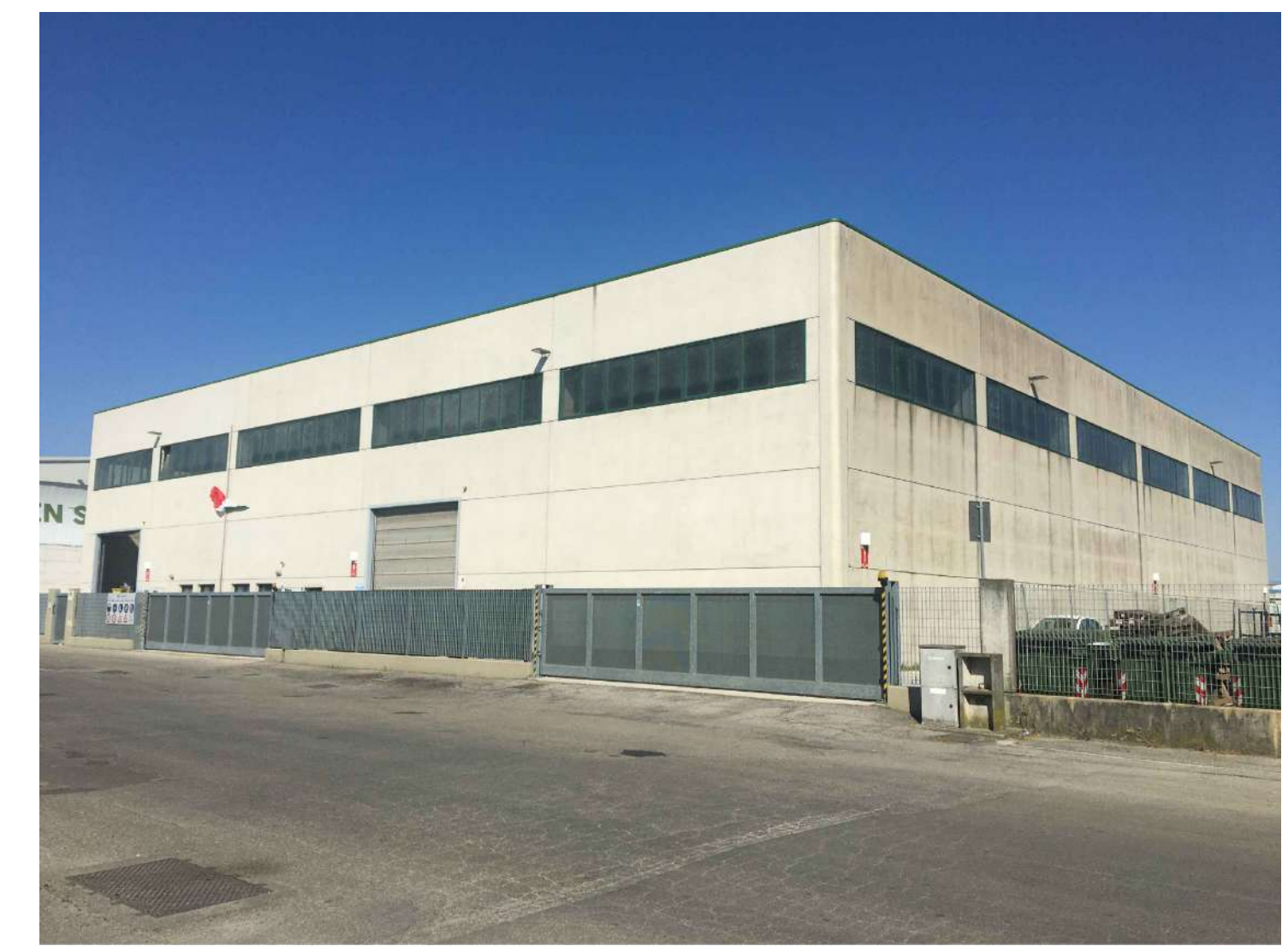
Fig. 08 - Vista lato Est civ. 54