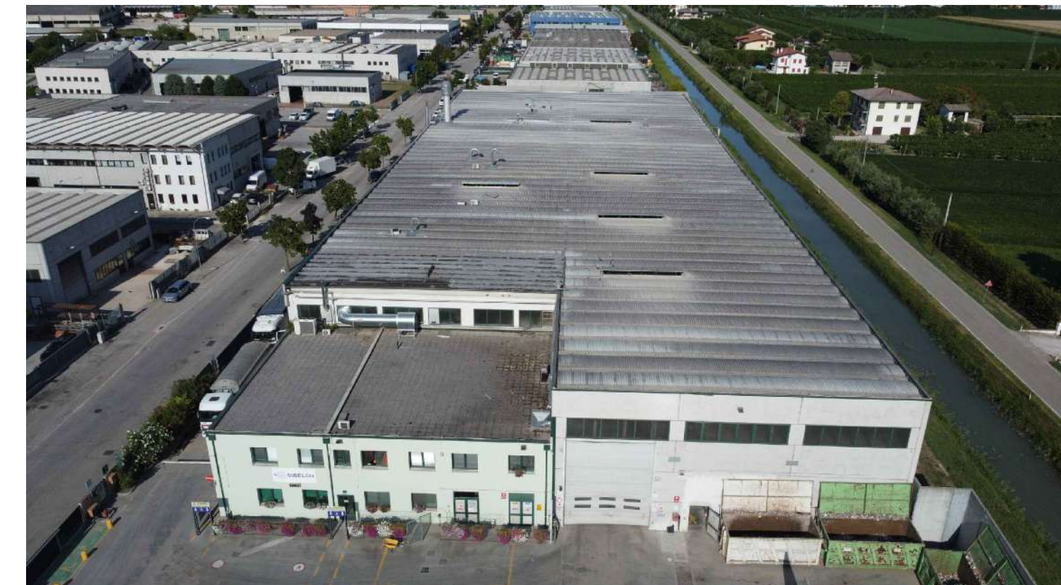
Fig. 02 - Vista lato Ovest civ. 41