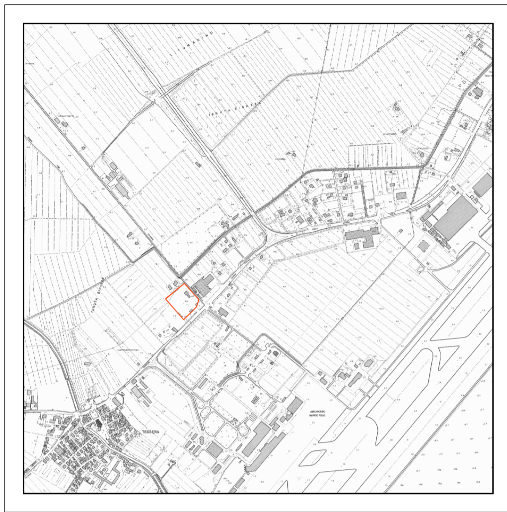
Corografia scala 1:20000