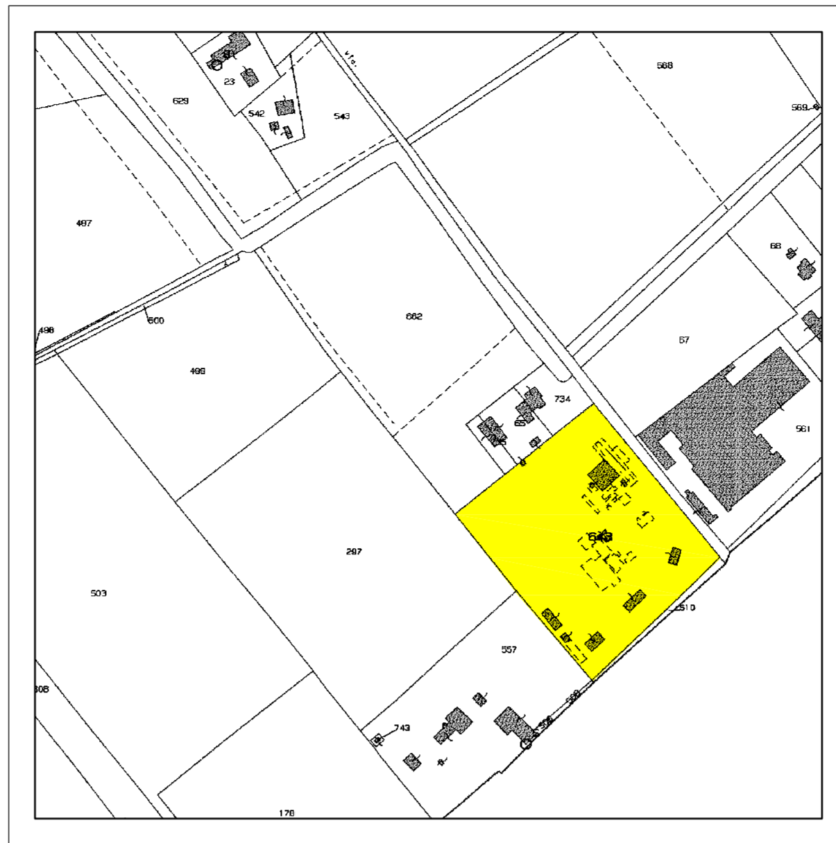
Estratto di mappa N.C.T. scala 1:4000

Committente: SUPERBETON S.p.A. Via Triestina, 163 - Venezia - fraz. Tessera (VE) Progetto: DOMANDA DI VERIFICA DI ASSOGGETTABILITA' PER DOMANDA DI A.U.A.