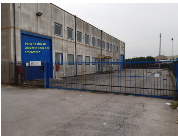
Immagine n. 2 – accesso carraio all'impianto

Le immagini seguenti illustrano l'accesso all'impianto che sia apre sulla via Malcontenta e la struttura esterna della facciata Est del fabbricato oggetto di trattazione.