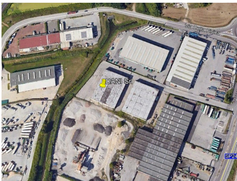
Immagine n. 1

L'impianto confina su tre lati con aree private appartenenti alla lottizzazione produttiva. In particolare a nord confina con la strada interna della Zona Industriale mentre ad Ovest confina con il canale consortile "Fondi a Sud".