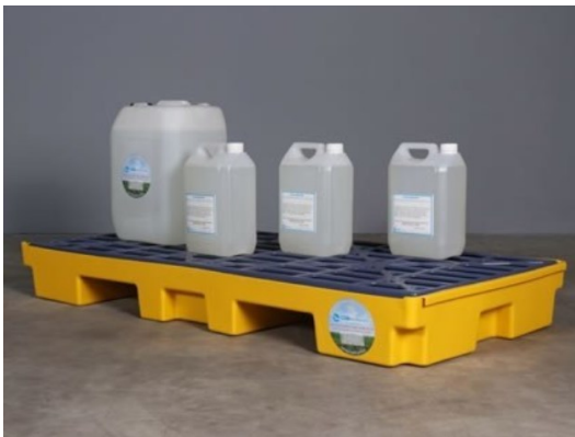
Immagine n. 4

Il bacino sarà dimensionato secondo le linee guida impartite dal MATT con Circolare prot. 1121.21-01-2019, vale a dire “I contenitori per rifiuti liquidi devono inoltre essere provvisti di un bacino di contenimento con un volume almeno pari al 100% del volume del singolo contenitore che vi insiste o, nel caso di più contenitori, almeno al 110% del volume dell’imballo avente volume maggiore” . In considerazione del fatto che la ditta proponente prediligerà l’utilizzo di contenitori a doppia camera, non è ad oggi possibile fissare a priori le dimensioni del bacino di contenimento in quanto, essendo lo stesso realizzato in moduli standard (3mx2mx0,4m (h)) potranno essere utilizzati più moduli.