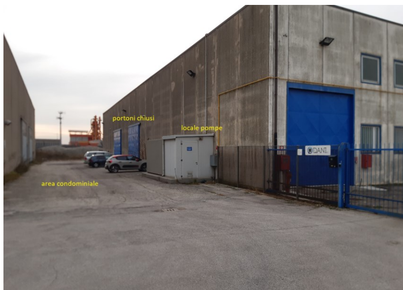
Immagine n. 3 – vista lato Est