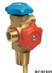
Immagine n. 5

Lista Adattatori per Bommole Serie K1 a Pag. 28e