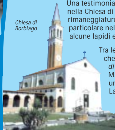
Chiesa di Borbiago

Una testimonianza dell'attività dei monaci ilariani sta nella Chiesa di Gambarare, che conserva – al di là delle rimaneggiature – tracce dello stile romanico, in particolare nel campanile, che conserva alcune lapidi e un fregio bizantino.