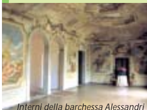
Interni della barchessa Alessandri

Il Settecento in particolare fu un periodo di intensa edificazione e l'influsso del Barocco portò molti proprietari ad arricchire ed ampliare le proprie dimore di pesanti decorazioni e vaste foresterie per la musica e il gioco. I giardini diventano più ricchi e sontuosi con piante e laghetti, palcoscenici fantasiosi per spettacoli all'aperto (sul modello dell'Alhambra spagnola), legati spesso al corso del fiume.