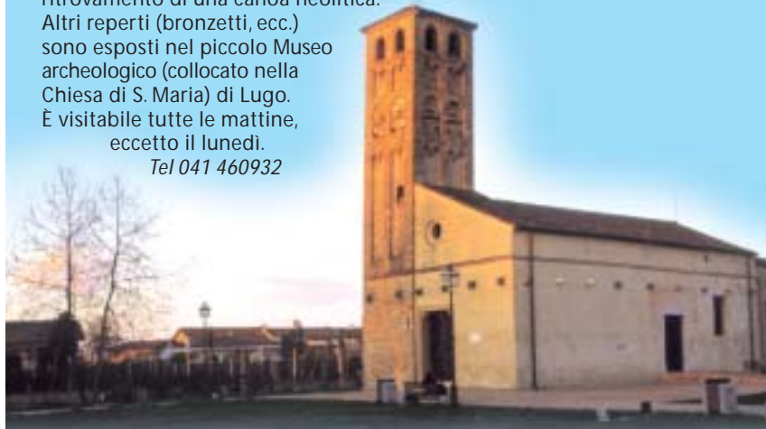
Chiesa di Santa M. di Lugo