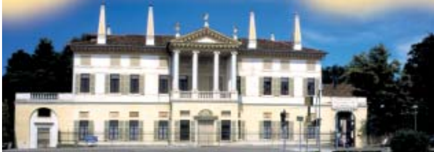
Villa Foscari Rossi

Nata come Casino dominicale a pianta veneziana, dedicata ai giochi e agli intrattenimenti della famiglia, dispone di un giardino che continua la prospettiva dall'ingresso. Si ricorda perché durante l'assedio di Venezia nel 1848 ospitò il generale Radetzky , ma furono tanti altri gli ospiti illustri che vi soggiornarono. È oggi visitabile nei festivi tramite Ville Aperte .