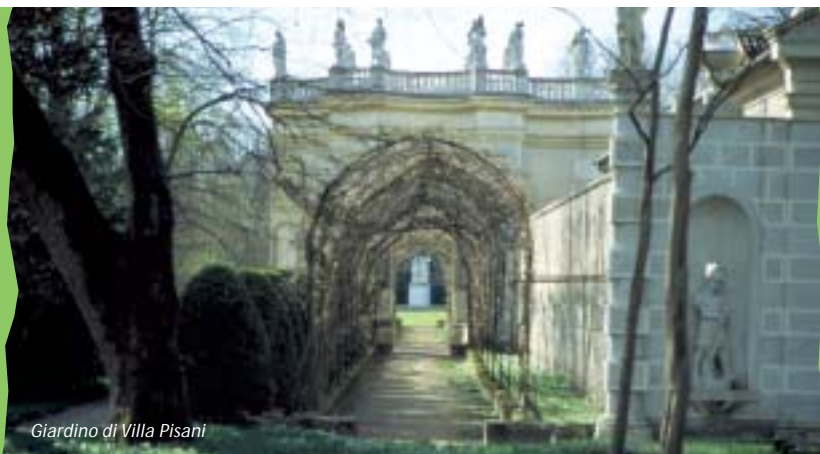
Giardino di Villa Pisani

In seguito, la villa divenne simbolo di nobiltà, luogo di svago e rappresentanza, e appunto di "villeggiatura": stare in terraferma acquistava anche un valore sociale. Nella fase della "Villa Riposo" (Sei-Settecento) il corpo principale dell'edificio viene dedicato all'abitazione per la villeggiatura e l'attività agraria si svolge solo nelle ali. Infine, esse abbandonano la funzione di rusticali e diventano definitivamente foresterie per il soggiorno degli ospiti (i "foresti" per l'appunto), senza dei quali la villeggiatura non sarebbe stata divertimento; le attività agricole vengono svolte in edifici separati dal complesso principale.