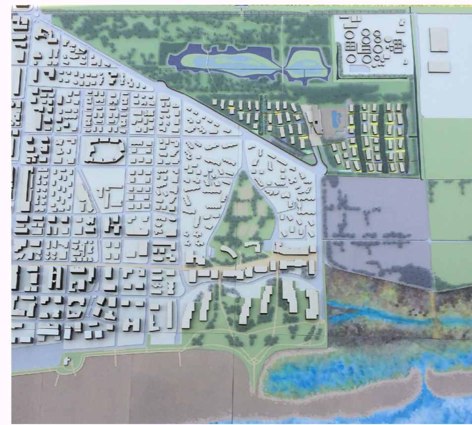
Progetto "Lino delle Fate", Parco della Biodiversità e Canale VII