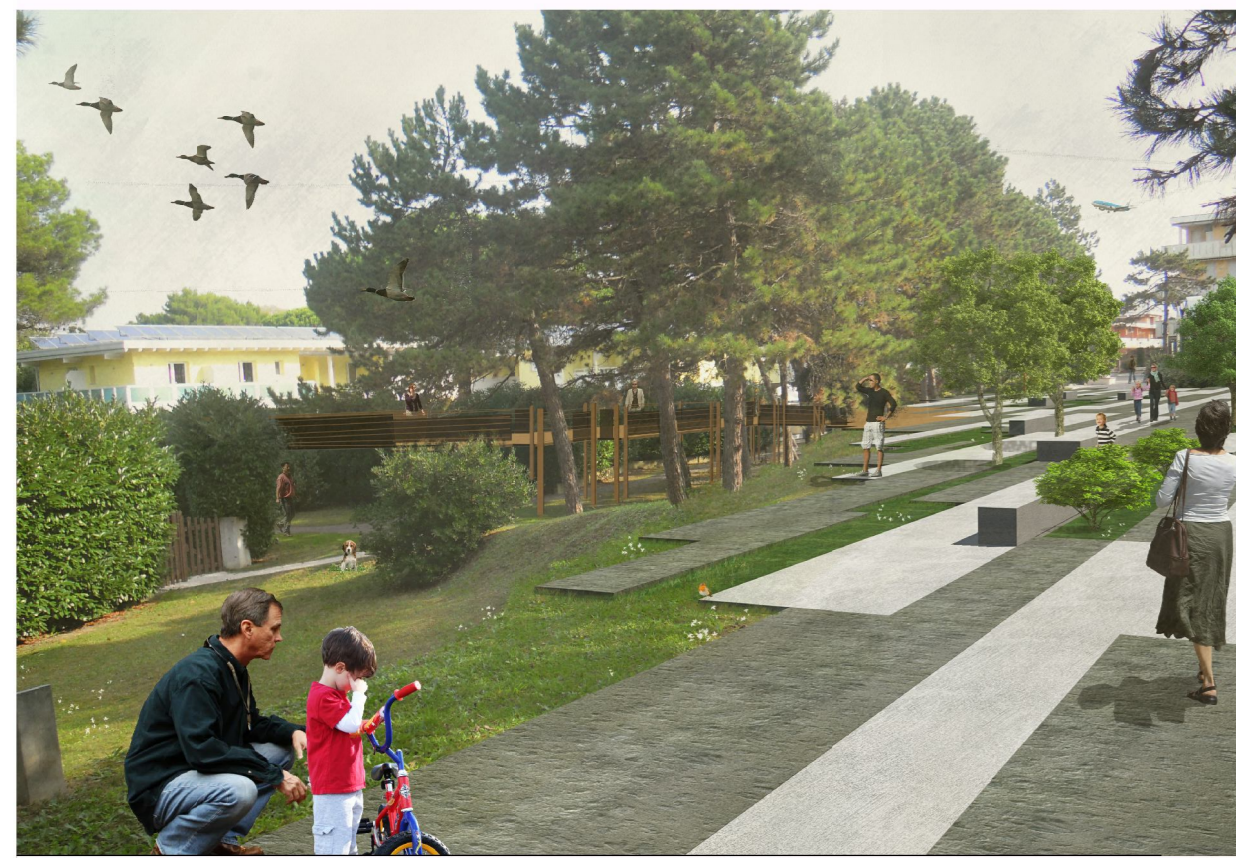
Progetto di riqualificazione e valorizzazione "Lido dei Pini"