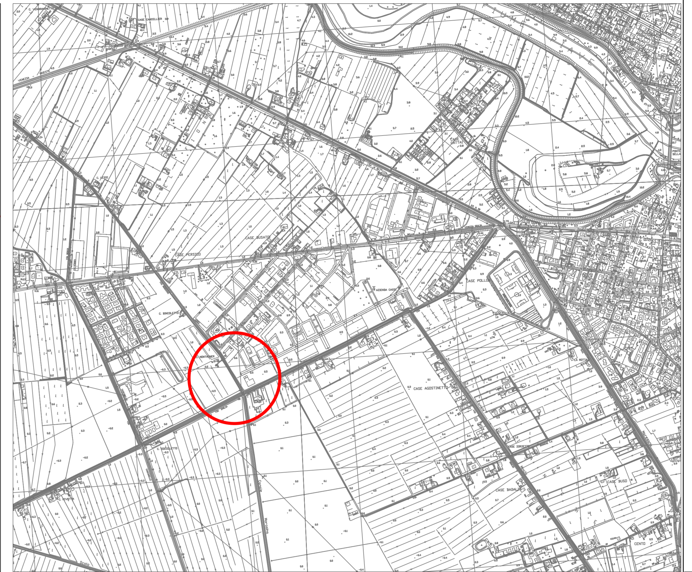
Estratto CTR SCALA 1:5000