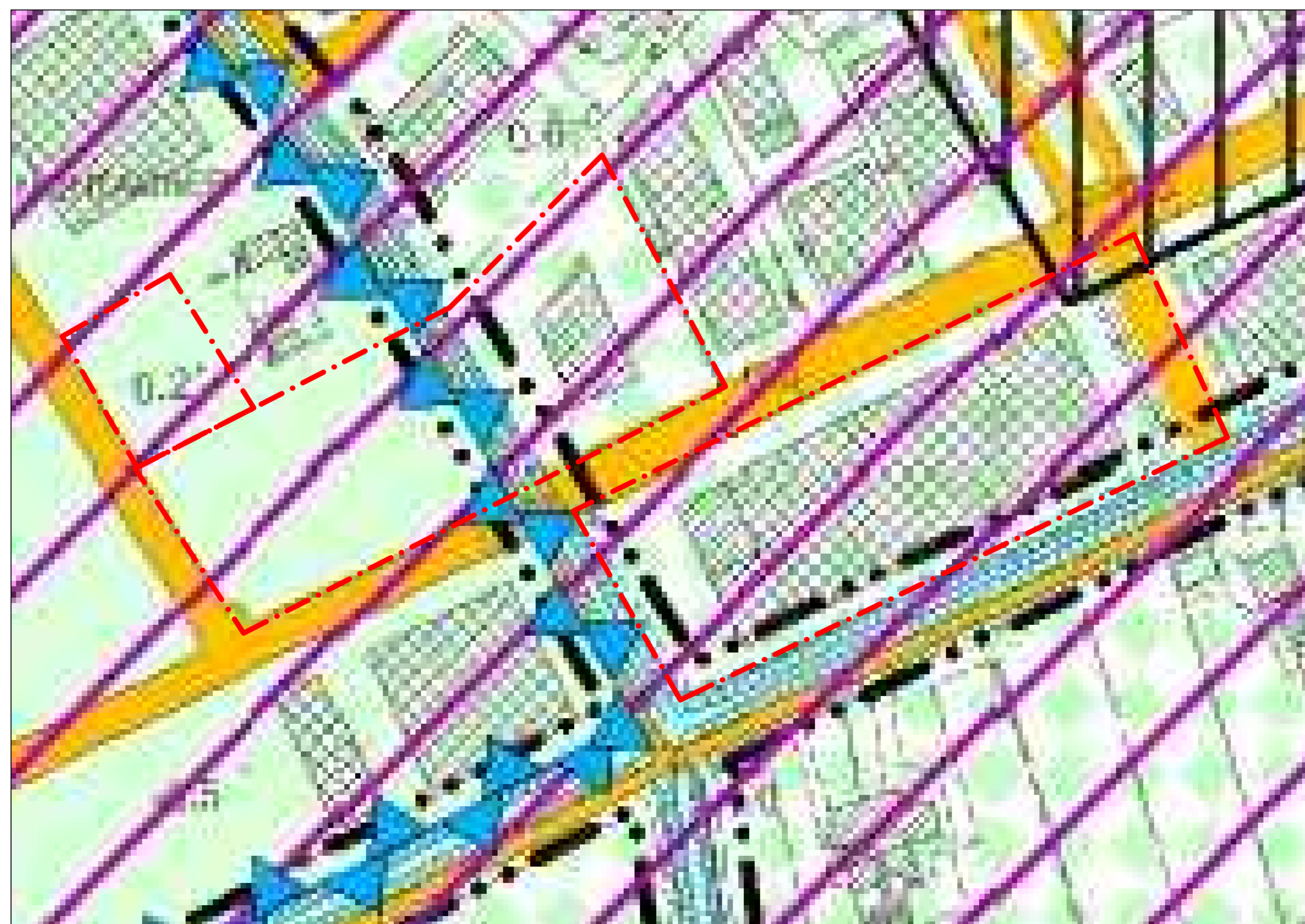
Estratto Carta dei Vincoli SCALA 1:2000